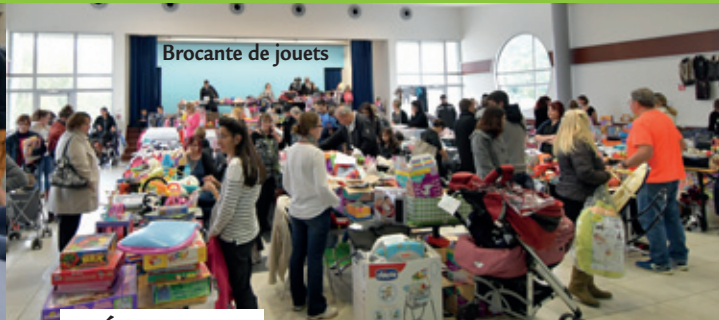
Brocante de jouets