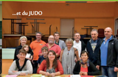
...et du JUDO