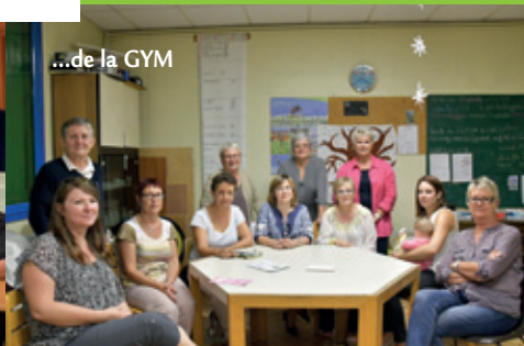
...de la GYM