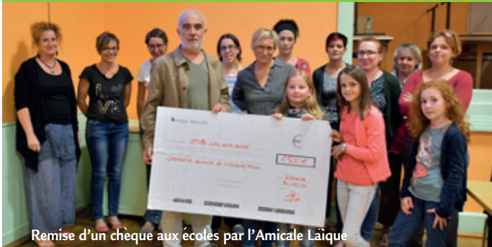
Remise d'un chèque aux écoles par l'Amicale Laïque